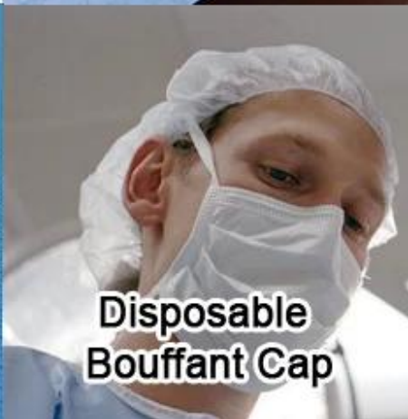
Disposable Bouffant Cap