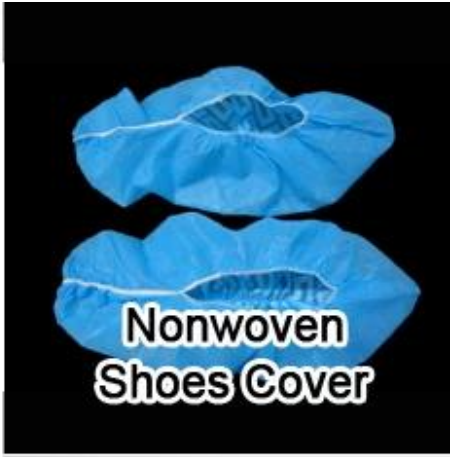
Nonwoven Shoes Cover