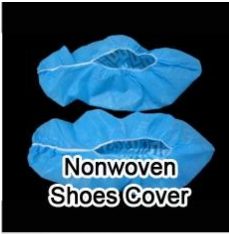
Nonwoven Shoes Cover