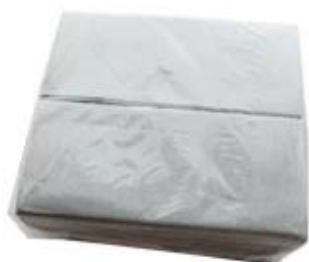
50/100 pcs per pack, individually packed per bag