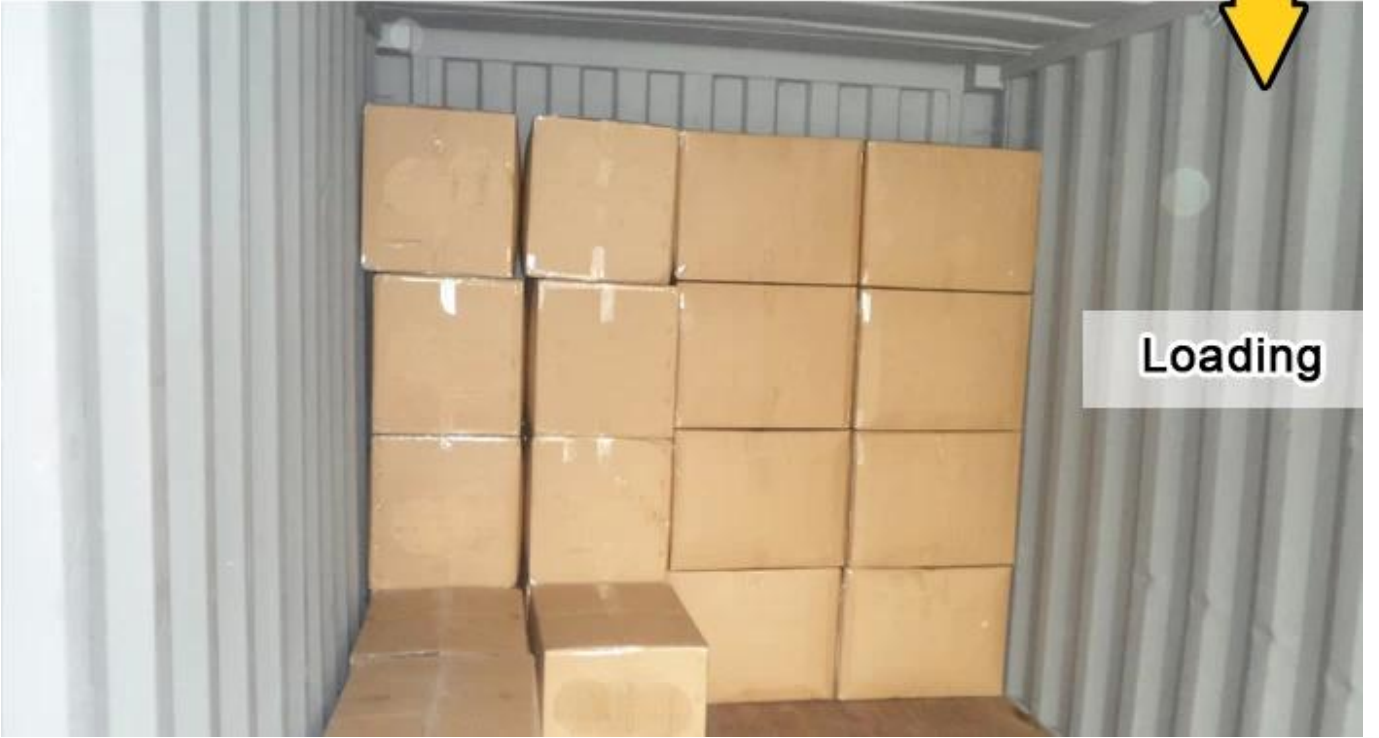
Ayakkabı Çanta İmalatı