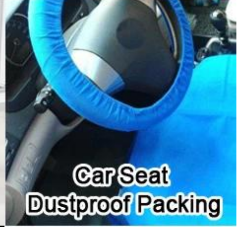
Car Seat Dustproof Packing