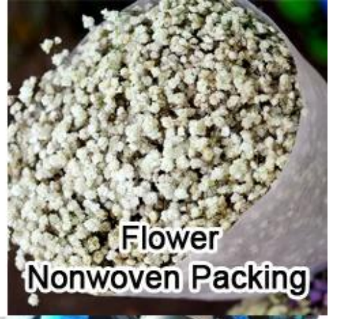
Flower Nonwoven Packing