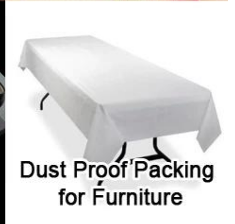
Dust Proof Packing for Furniture

Ürün Ambalaj ve Ambalaj Şekli Ambalaj JL-2025 için Kalp Şekli Baskı Polyester Spunbond Sigara Dokuma Kumaş