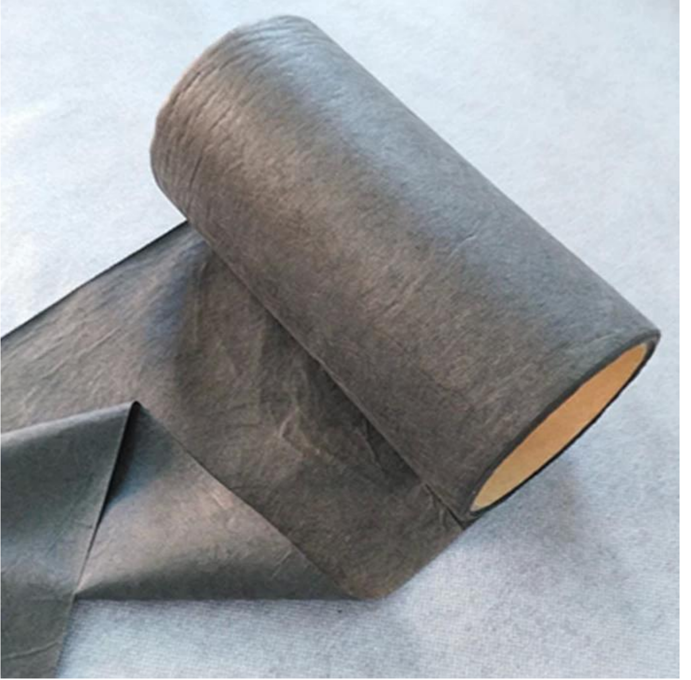
Üflemeli Kumaş Satıcısı Eriyik

Meltblown Filtre Amerikan Standardı Ürün Paketleme ve Nakliye