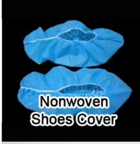
Nonwoven Shoes Cover