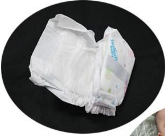
pp hot air through non woven fabric