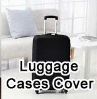
Luggage Cases Cover