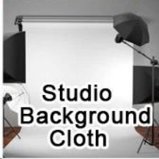
Studio Background Cloth