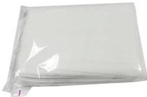
30 pieces/bag, or custom-order