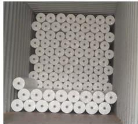
loaded in container