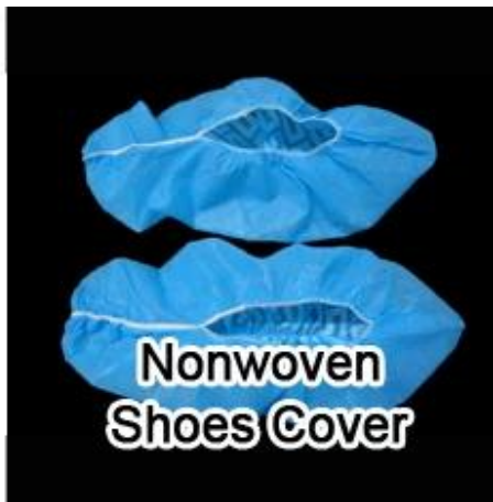
Nonwoven Shoes Cover