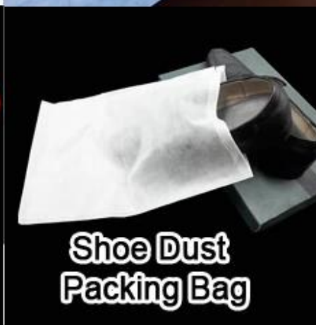
Shoe Dust Packing Bag