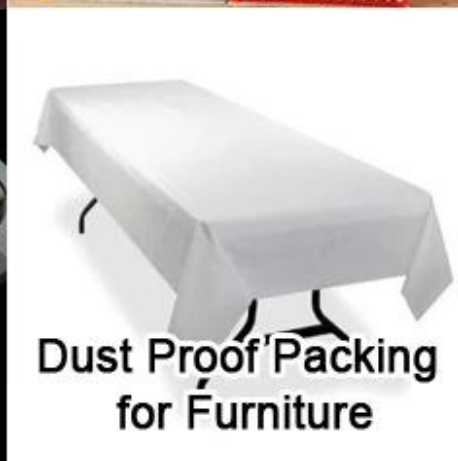
Dust Proof Packing for Furniture

Empacotamento do produto e transporte da tela não tecida de Spunbond do poliéster da impressão da flor para a decoração JL-3092