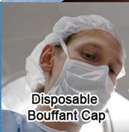
Disposable Bouffant Cap