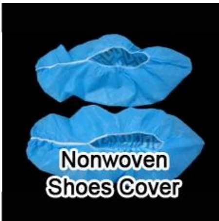
Nonwoven Shoes Cover