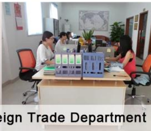
Foreign Trade Department