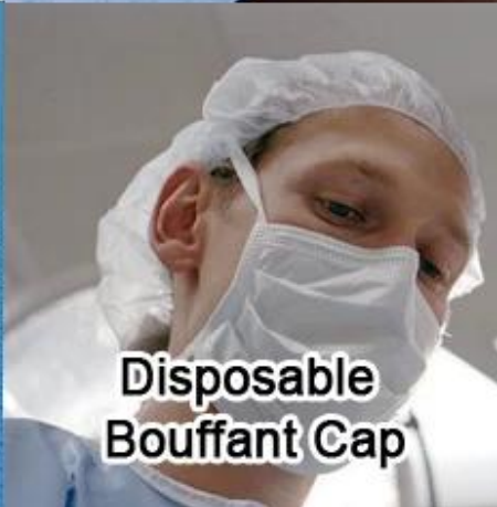
Disposable Bouffant Cap