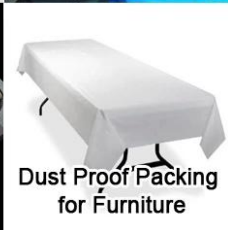
Dust Proof Packing for Furniture