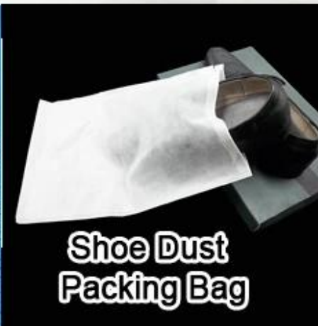
Shoe Dust Packing Bag