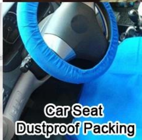
Car Seat Dustproof Packing