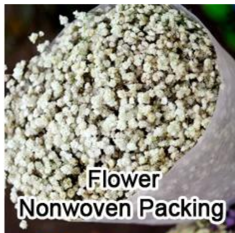
Flower Nonwoven Packing