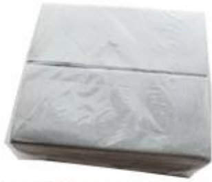
50/100 pcs per pack, individually packed per bag