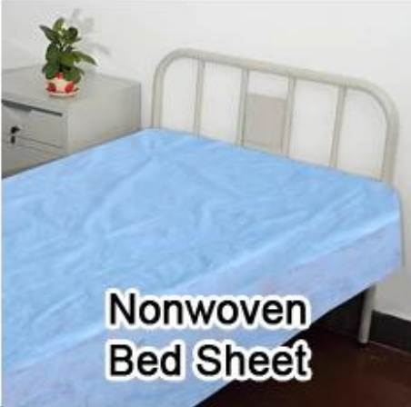
Nonwoven Bed Sheet