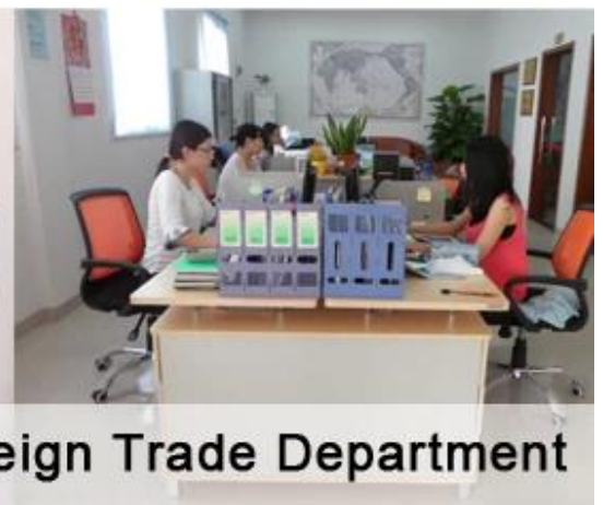
Foreign Trade Department