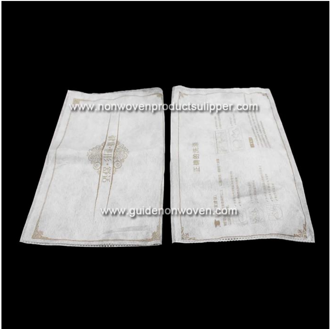
Imballaggio e spedizione del prodotto Sacchetto di imballaggio per la sicurezza della borsa della biancheria intima non confezionata personalizzata