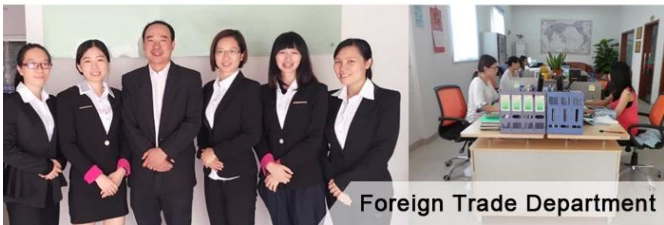
Foreign Trade Department