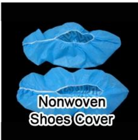
Nonwoven Shoes Cover