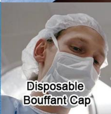
Disposable Bouffant Cap