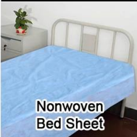
Nonwoven Bed Sheet