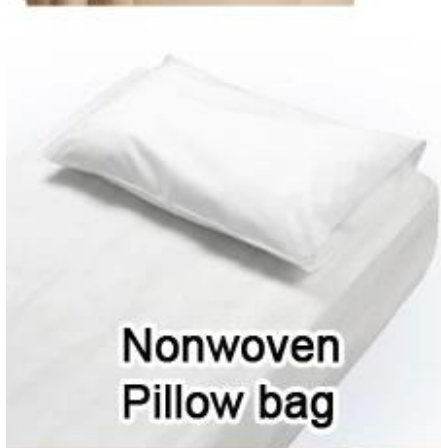
Nonwoven Pillow bag