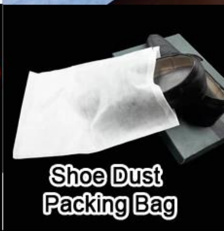
Shoe Dust Packing Bag