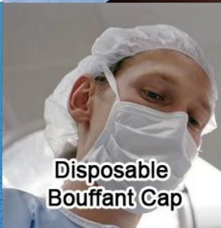
Disposable Bouffant Cap