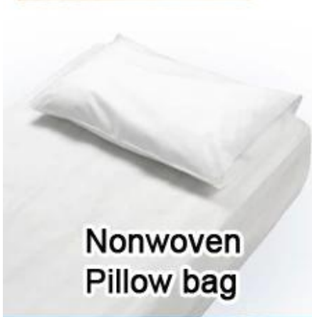
Nonwoven Pillow bag