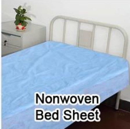
Nonwoven Bed Sheet