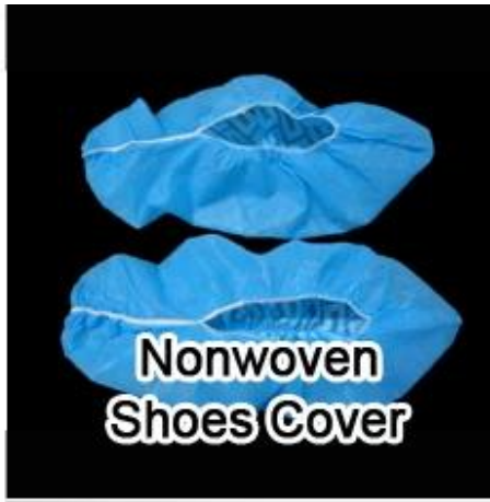
Nonwoven Shoes Cover