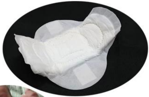
pp spunbond perforated non woven fabric