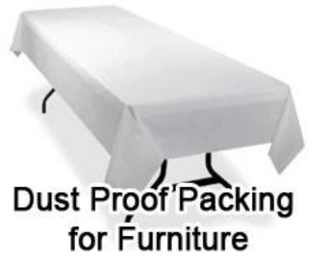
Dust Proof Packing for Furniture

Confezione del prodotto e spedizione di carta da imballaggio in tessuto non tessuto fresco