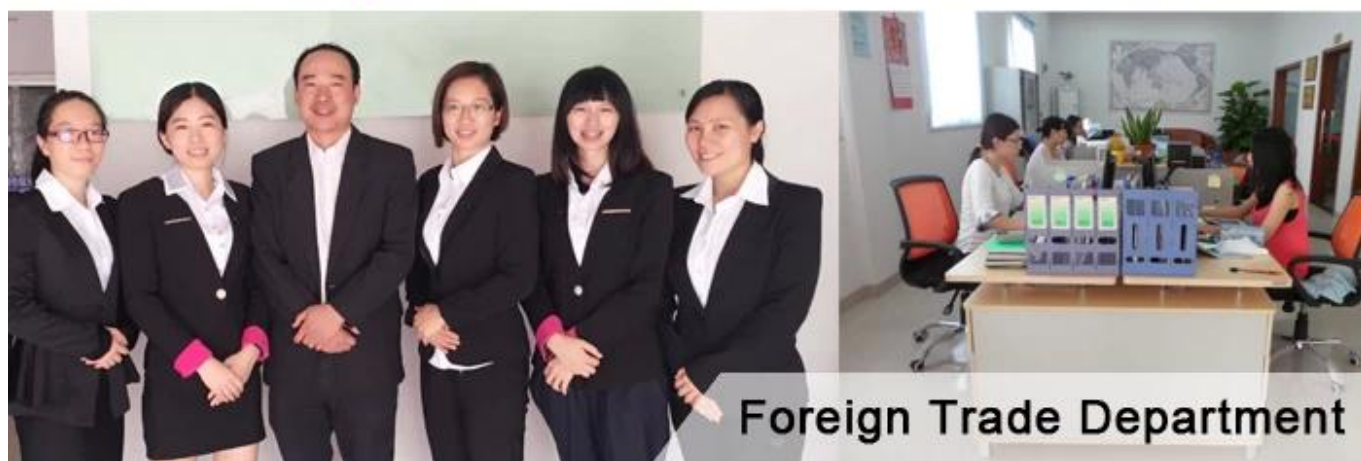
Foreign Trade Department