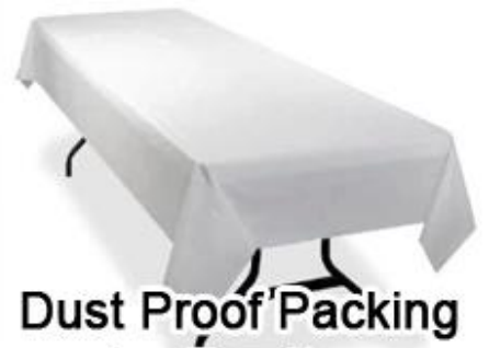
Dust Proof Packing for Furniture

Imballaggio del prodotto e spedizione del tessuto non tessuto per imballaggio in rotoli