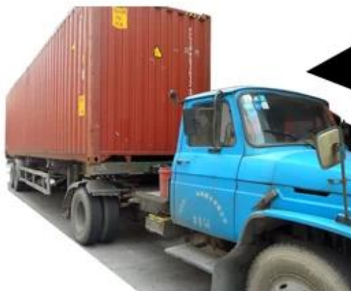
transporting the goods to the port