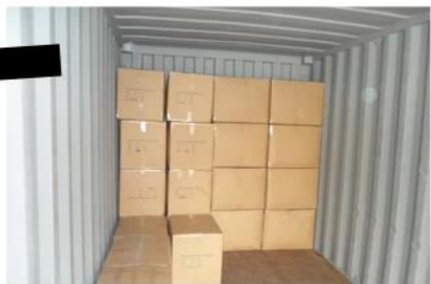
loaded in container