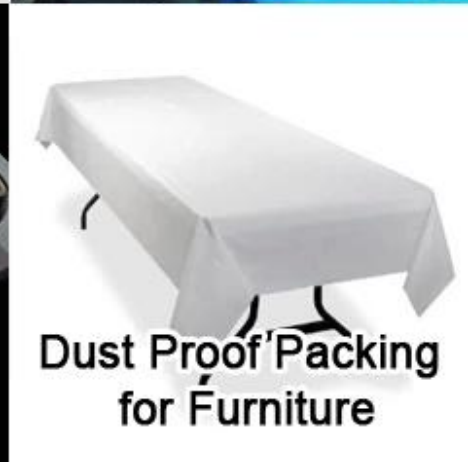
Dust Proof Packing for Furniture

Embalaje del producto y envío de papel de envolver tejido