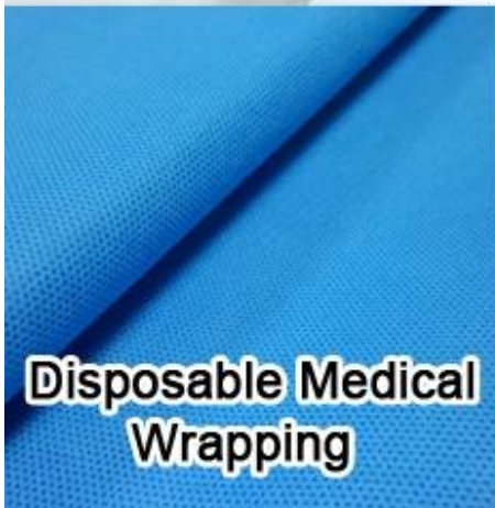
Disposable Medical Wrapping