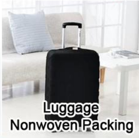
Luggage Nonwoven Packing