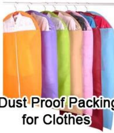
Dust Proof Packing for Clothes