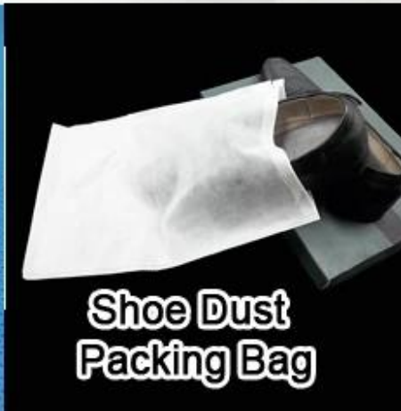
Shoe Dust Packing Bag