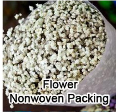
Flower Nonwoven Packing