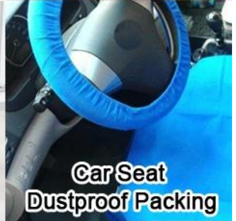
Car Seat Dustproof Packing