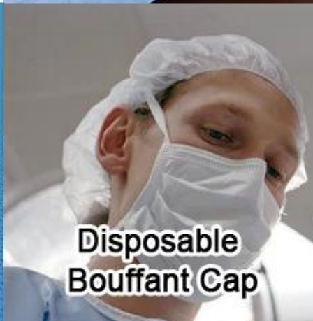
Disposable Bouffant Cap