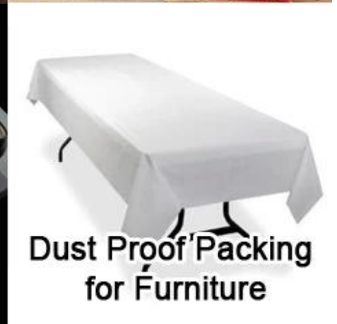
Dust Proof Packing for Furniture

Empaquetado y envío del producto de la tela de la tela no tejida de Spunbond del poliéster de la impresión para la decoración JL-3092