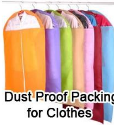
Dust Proof Packing for Clothes