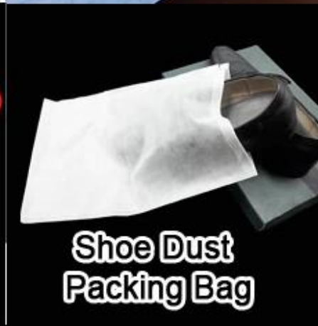
Shoe Dust Packing Bag