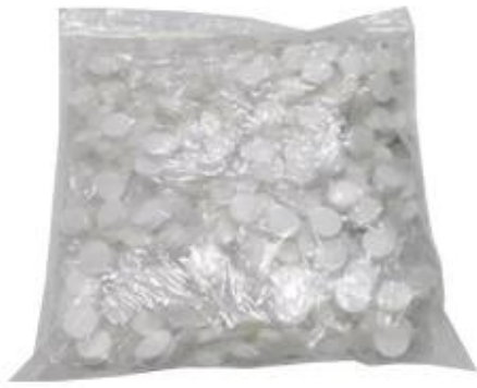
100pieces/bag, or custom-order