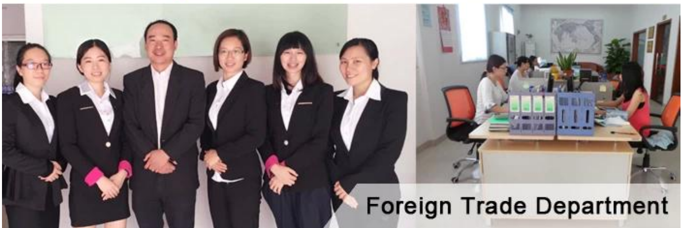
Foreign Trade Department