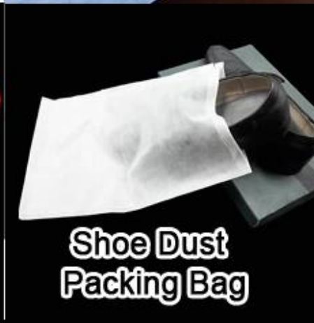
Shoe Dust Packing Bag