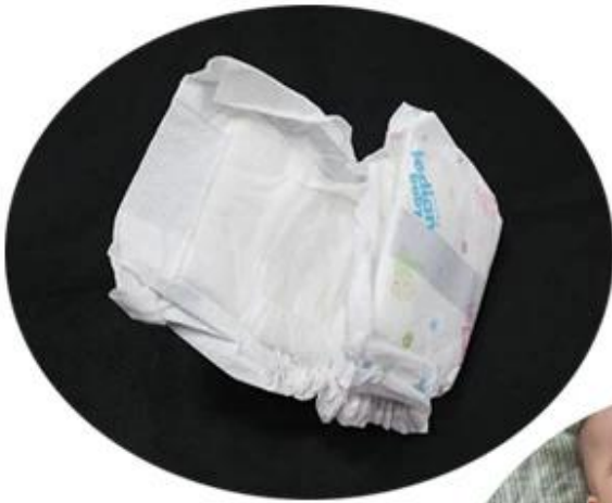
pp hot air through non woven fabric