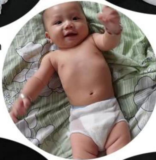
pp spunbond perforated non woven fabric