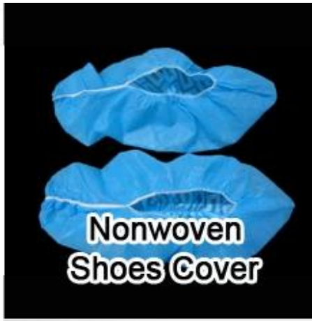
Nonwoven Shoes Cover