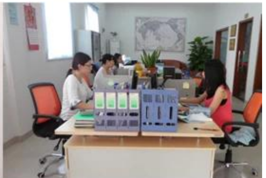
Foreign Trade Department