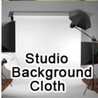
Studio Background Cloth