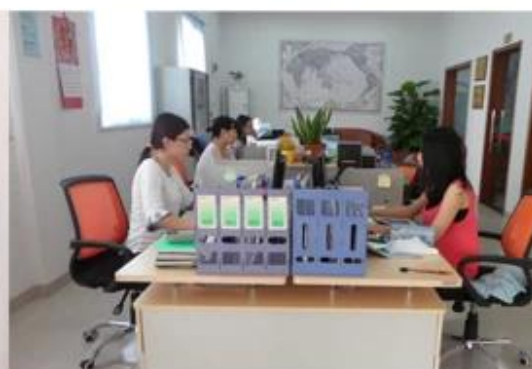
Foreign Trade Department