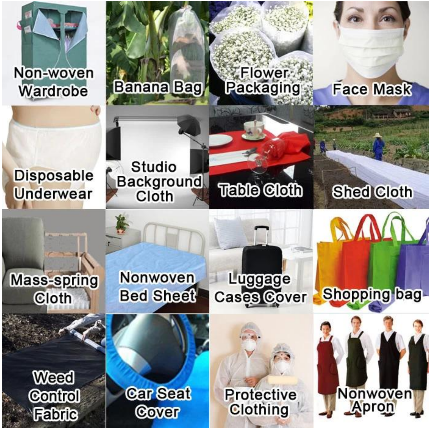
غير المنسوجة مسح المواد Meltblown المنتج التعبئة والتغليف والشحن من مادة البولي بروبيلين