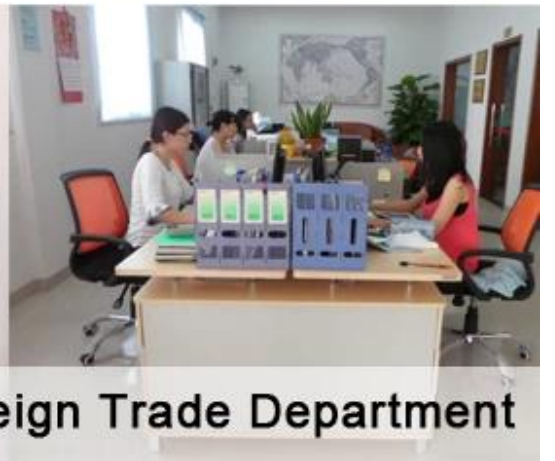
Foreign Trade Department