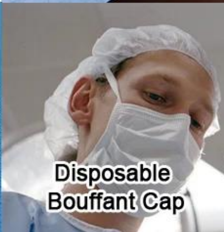
Disposable Bouffant Cap