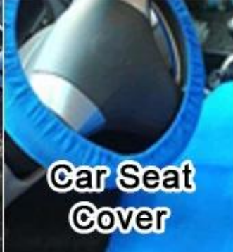
Car Seat Cover