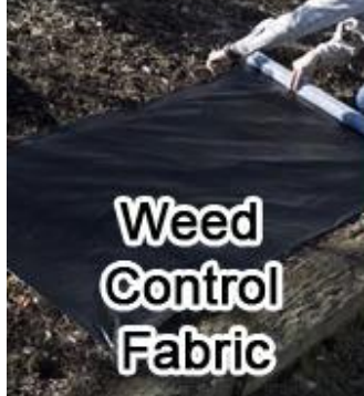
Weed Control Fabric