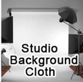
Studio Background Cloth