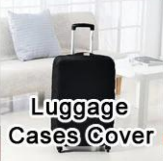
Luggage Cases Cover