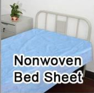
Nonwoven Bed Sheet