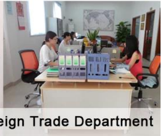
Foreign Trade Department